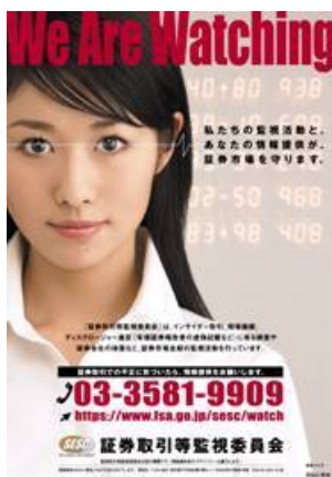
一般からの情報提供を求めるポスター

インターネットからの情報のご提供は、証券取引等監視委員会ウェブサイトの 情報受付窓口 からお願いします。