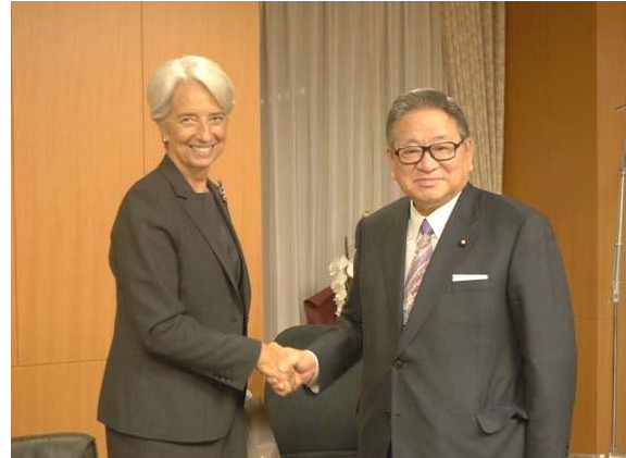
ラガルド国際通貨基金 (IMF) 専務理事 (左) と握手する自見大臣 (右) (大臣室にて) (11月11日)