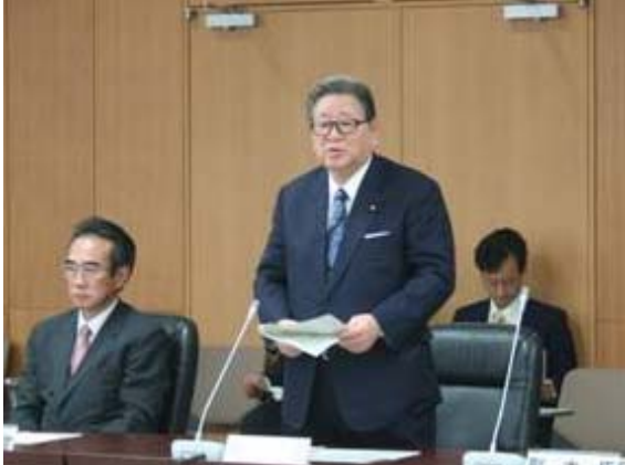
財務局長会議で挨拶をする自見大臣 (11月1日)