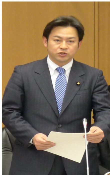
財務局長会議にて挨拶する福岡大臣政務官 (4月24日)