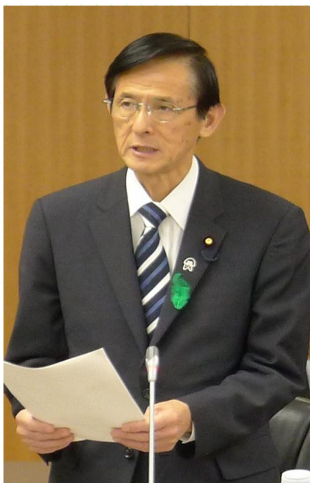
財務局長会議にて挨拶する岡田副大臣 (4月24日)