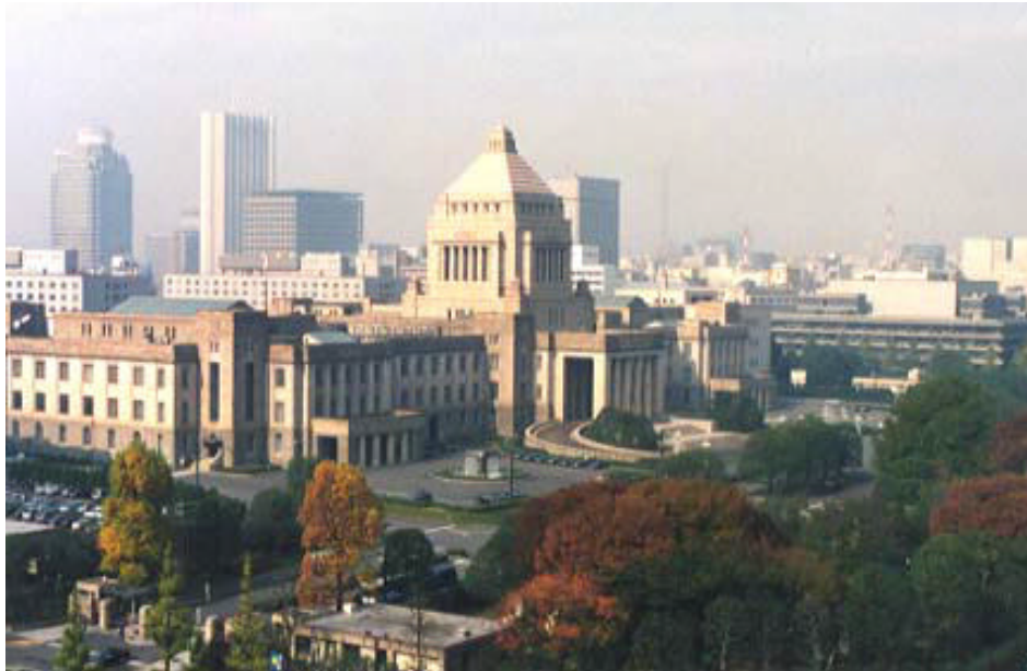
(金融庁から望んだ国会議事堂)