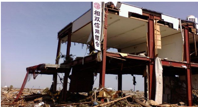
〔写真上2枚〕 相馬市原釜・松川浦地区の津波後の状況 〔写真下〕 津波で全壊となった当信用組合相馬港支店 (福島県相馬市同地区内)