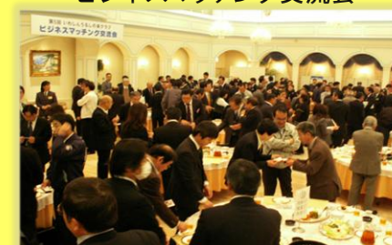
(平成23年2月22日開催) 参加企業 125社