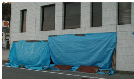
【津波被害により倒壊した中之作支店】