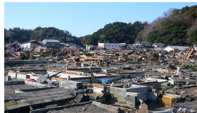
【豊間・薄磯地区の被災状況】

さらに、その後の原発事故の影響により、立入が困難な地域も多く、被災状況の確認も未だ困難なほか、今後の影響の拡大が懸念される状況となっております。