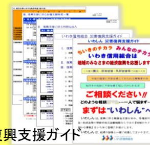
いわしん 災害復興支援ガイド