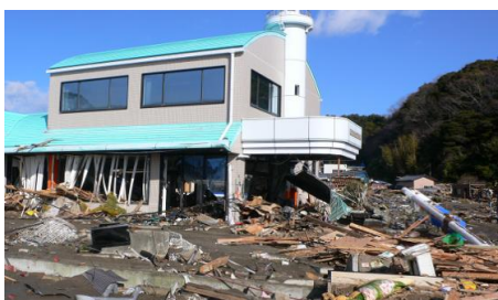
【津波被害により倒壊した塩屋崎支店】

塩屋崎支店、中之作支店が、津波により全壊し、原発影響による立入禁止の警戒区域内にある檜葉支店が営業できないなど、今般の事態は、まさに当信用組合創立以来の極めて深刻かつ重要な危機であると認識しております。