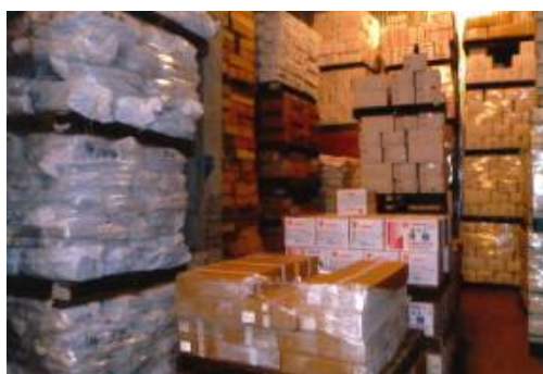
< ABL実績の事例 > 冷凍海産物