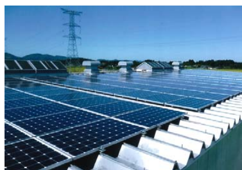
< ABL実績の事例 > 太陽光設備