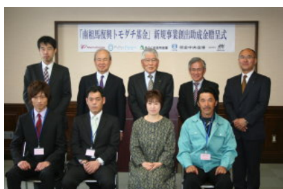
《第 2 回助成金贈呈式の模様》