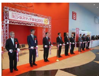
《ビジネスマッチ東北 2013 の模様》