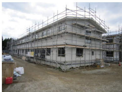
《広野町仮設宿泊施設建設現場》