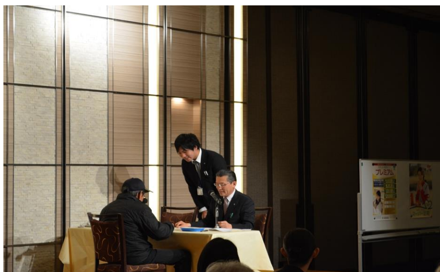
窓口対応ロールプレイング発表会（26年3月）