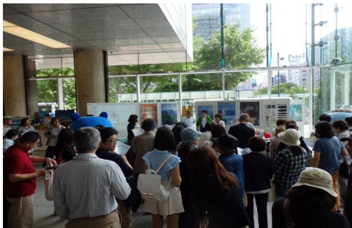
【知床フェア観光プロモーションの様子】平成 27 年 7 月