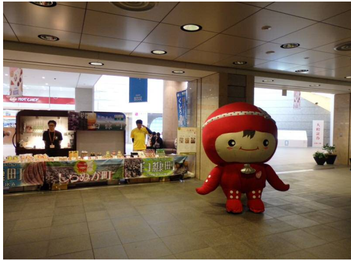
【白糠町特産品販売会場】平成 27 年 4 月