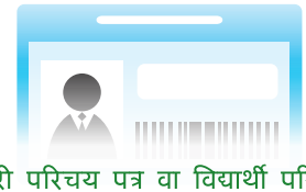
कर्मचारी परिचय पत्र वा विद्यार्थी परिचय पत्र ( नभएमा कम्पनी तथा विद्यालयका कर्मचारीसँगै बैंकमा जानुहोला ।)

वित्तीय संस्थाले आफूले उपलब्ध गर्ने वस्तु/सेवा रकम सापटी या आतंकवादीको चन्दामा प्रयोग नहुने गरी अन्तराष्ट्रिय समाजको अपिल या कानूनको उद्देश्यको पालना गर्नु आवश्यक छ ।