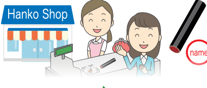
हान्को छाप (केही वित्तीय संस्थाहरुले हस्ताक्षरलाई स्विकारछन)