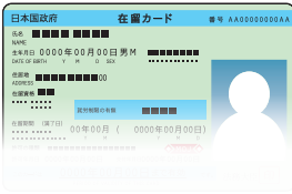
रेजीडेन्ट कार्ड राहदानी

(आवश्यक कागजातहरु वित्तीय संस्था अनुसार फरक हुन्छ । वित्तीय संस्था अनुसार धेरै या थोरै आवश्यक हुन सक्छ ।)