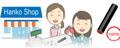
印章 (有时签字也可以。)