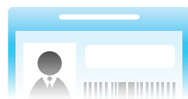
公司的员工证或学生证 (如果没有, 请与公司 或学校的人员一起去银行。)

金融机构经营的商品和服务, 需遵从国际社会的呼吁和法律, 不得被洗钱或恐怖活动所利用。