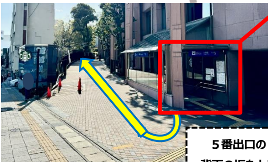
5番出口の 背面の坂を上る