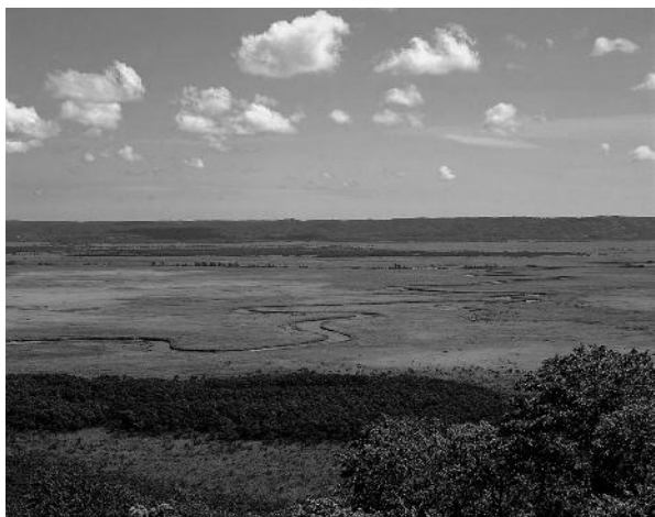
写真4 宮島岬先端部分からの展望

これらの課題に対応することは、地域の自然環境の保全と、ATに期待される質の高い体験価値を持続的に提供するための前提条件であると考えられる。