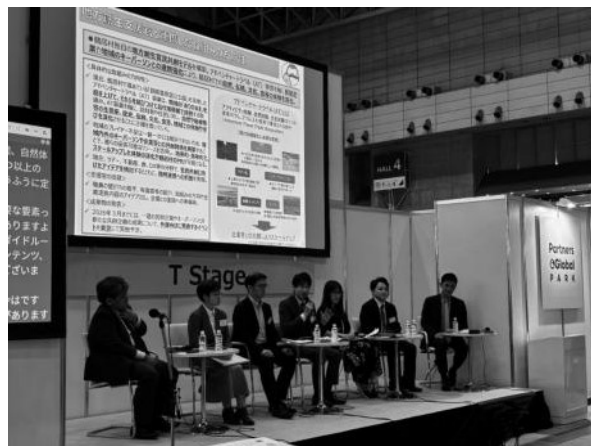
写真5 CEATEC2025でのパネルディスカッションの様子

令和8年2月5日には、これまで鶴居村が進めてきたAT事業の成果を首都圏から全国へ広く発信するため、「北海道鶴居村 稼げる観光へアドベンチャートラベル発表会」が開催された。発表会では、支援官チームも登壇し、この1年間の支援活動を総括した。