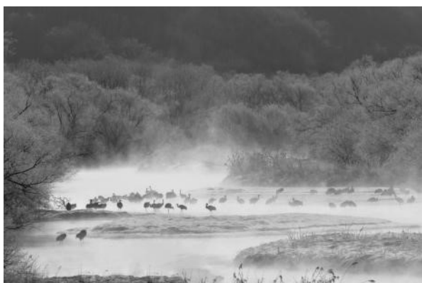
写真2 北海道東部の雪裡川。冬でも凍らないため、タンチョウのねぐらとされる。川に架かる音羽橋は、間近でタンチョウの姿を観察できる名所として知られ、世界中から多くの写真家が訪れる。