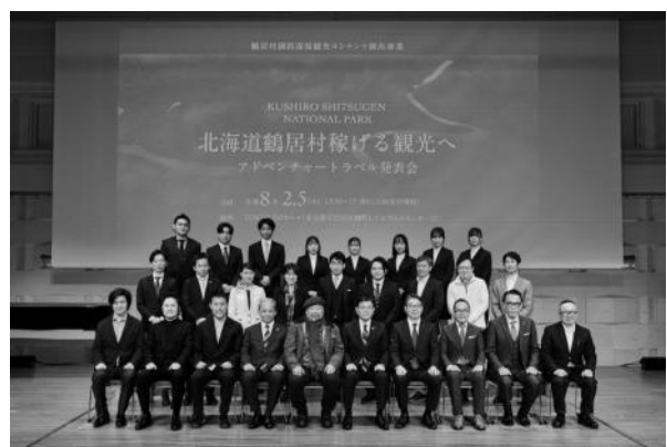
写真7 登壇者による集合写真

今回の発表会には約130名が参加し、自然体験と地域文化を組み合わせた鶴居村独自の観光の未来像が示され、参加者はその魅力や可能性を共有した。関係者同士のネットワークが広がる貴重な場にもなり、地域一体となった観光産業づくりへの動きを後押しする契機になりそうだ。今後、鶴居村は自然と共生する観光の価値を磨き続け、その魅力を国内外へ発信する取組を一層強化していく予定である。鶴居村の挑戦は始まったばかりだ。