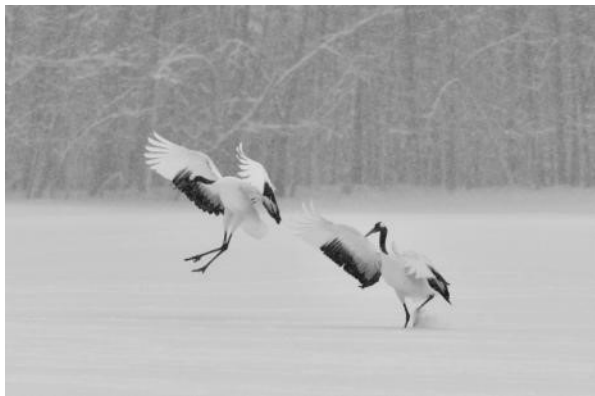
写真1 鶴居村のタンチョウ