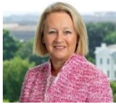
Mary L. Schapiro