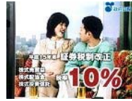
【テレビスポット】(政府広報) ★ 大幅な証券減税 「ビデオレター編」