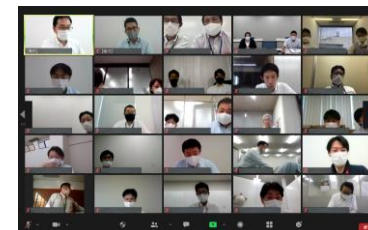
オンライン勉強会の模様