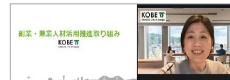
<自治体説明の様様>