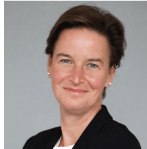
ベレーナ・ロス ESMA長官