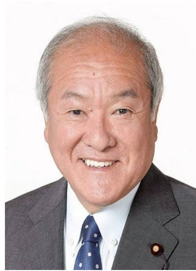
鈴木 俊一 財務大臣 内閣府特命担当大臣(金融)