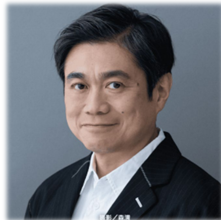
伊藤 穰一 千葉工業大学学長