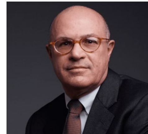
クリス・ジャンカルロ 元CFTC長官