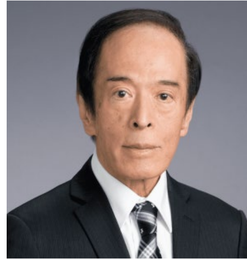
植田 和男 日本銀行総裁