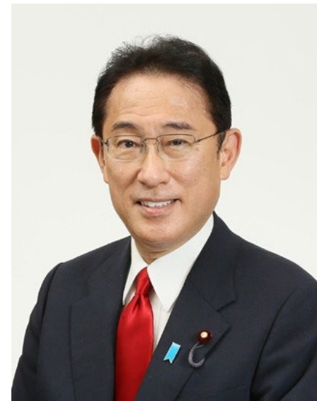
岸田 文雄 内閣総理大臣