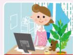
インターネットで