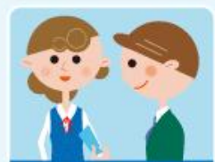
商品券やカタログギフト券