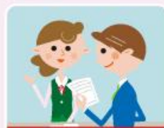
資金移動業者の窓口で