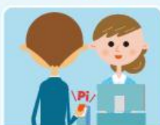
磁気型やIC型のプリペイドカード