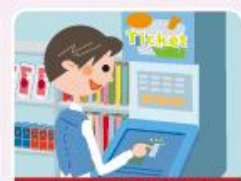
旅行代理店の窓口やコンビニで