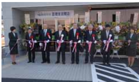
《亘理支店オープンの模様》