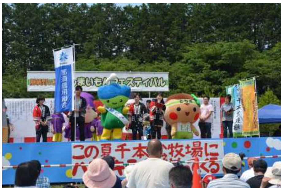
那須野ヶ原うんまいもんフェスティバル（27年5月）

更に、平成27年5月に開催された西那須野商工会主催による「那須野ヶ原うんまいもんフェスティバル」のグルメイベントに、当信用組合のマスコットキャラクター「茶那丸くん」も参加し、放射能汚染による風評被害等の影響を受け客数が減少している飲食店や観光施設に対し、PRのお手伝いをさせて頂きました。