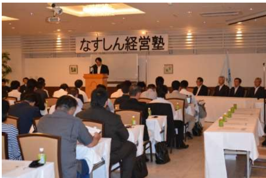
なすしん経営塾（27年5月）

更に、平成27年5月に開催された西那須野商工会主催による「那須野ヶ原うんまいもんフェスティバル」のグルメイベントに、当信用組合のマスコットキャラクター「茶那丸くん」も参加し、放射能汚染による風評被害等の影響を受け客数が減少している飲食店や観光施設に対し、PRのお手伝いをさせて頂きました。