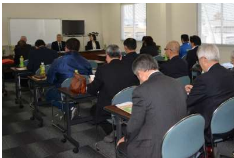
事業承継セミナー（27年2月）

平成 27 年 2 月、「公益財団法人栃木県産業振興センター」より講師を招き、お客様を対象とした当信用組合独自の事業承継に関するセミナーを開催いたしました。