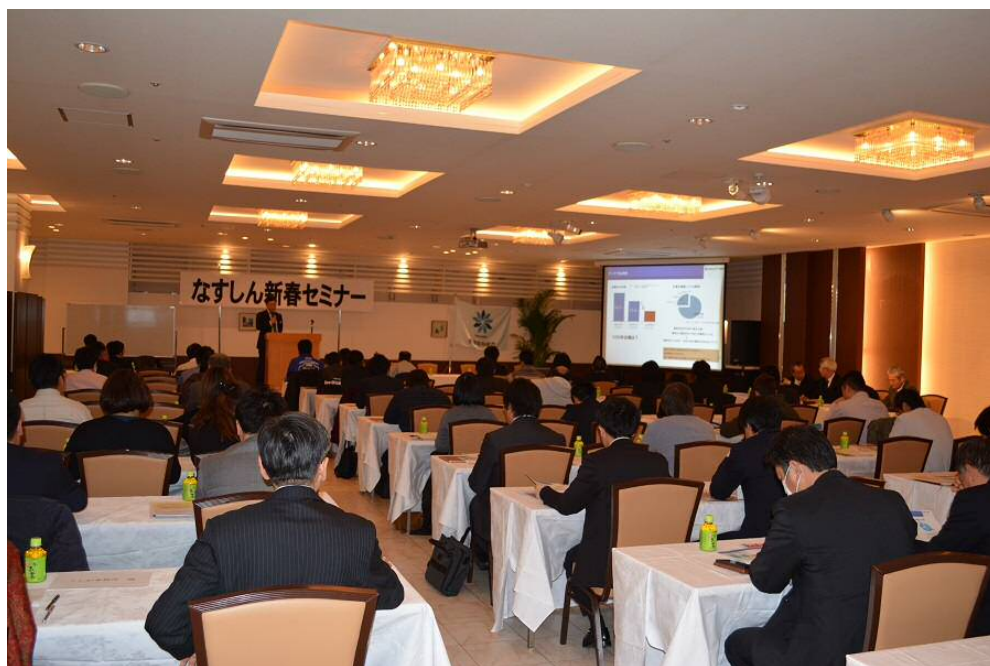
【平成29年2月3日 なすしん経営クラブ 新春セミナー】