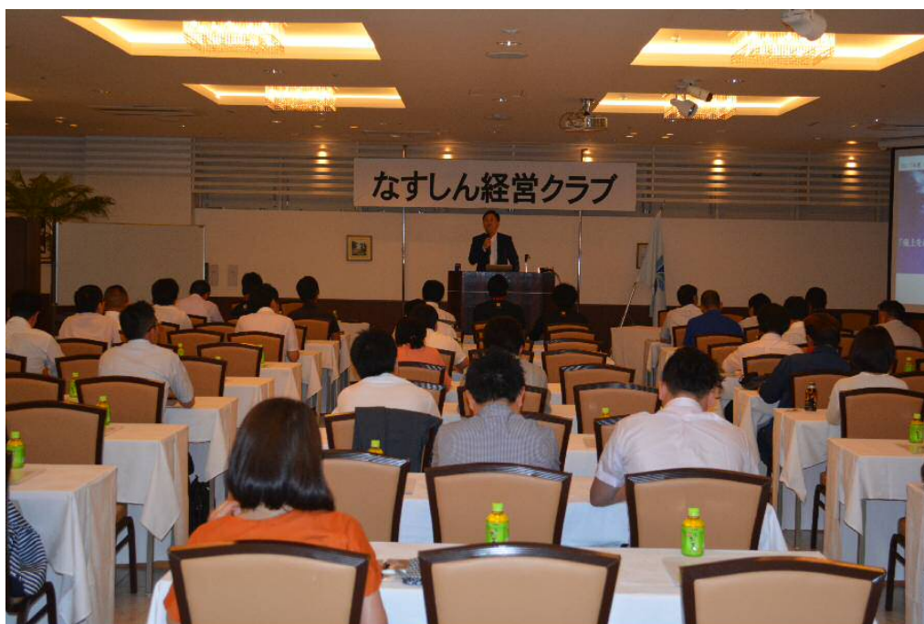
【平成29年7月14日 なすしん経営クラブ 経営セミナー】

今後も、組合員の皆様と当信用組合の継続的な関わりの場、創業又は新事業の開拓の場として、地域・組合員・そして当信用組合が共に成長・発展していくという「好循環」の実現に向け取り組んで参ります。