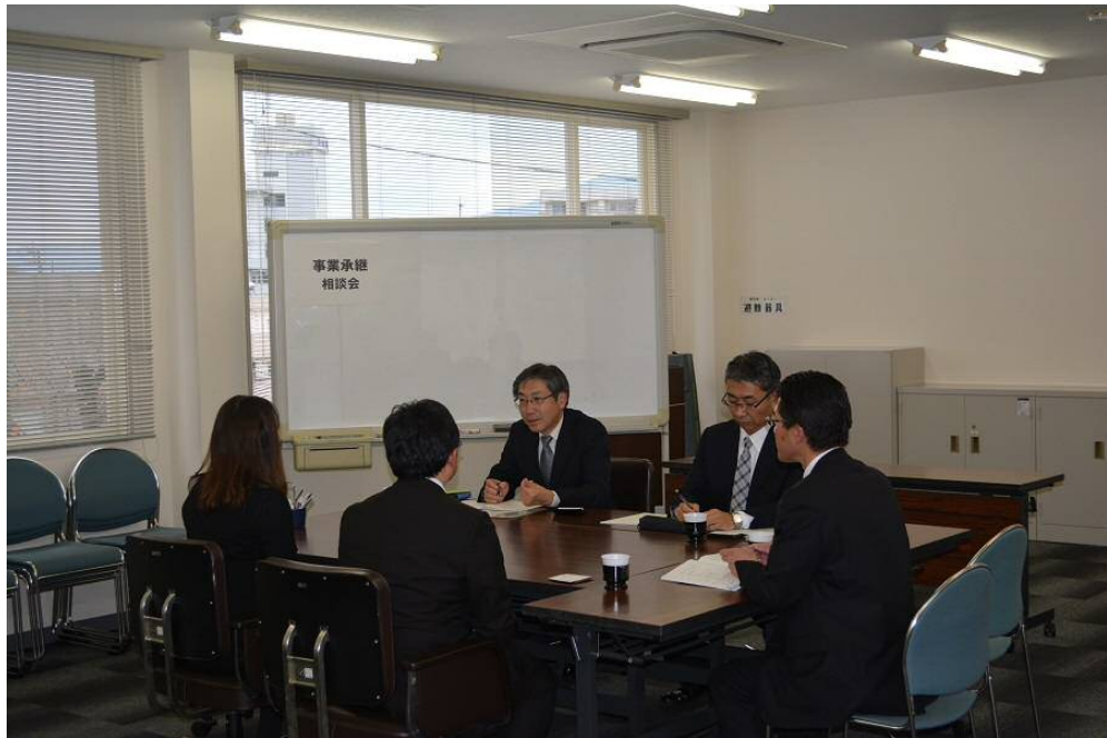
【平成 29 年 11 月 27 日 事業承継・M&A 相談会】