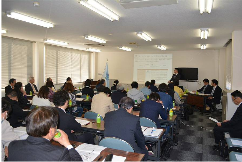
【平成 29 年 4 月 14 日 クラウドファンディング説明会】