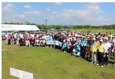
《あぶくま信金杯大会》