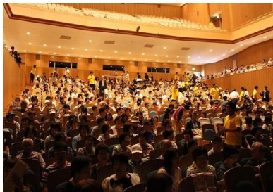
《来場したお客様の様子》