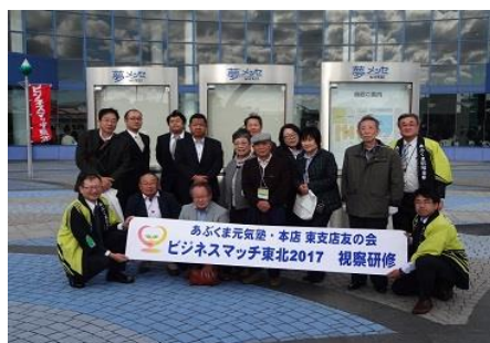
《ビジネスマッチ東北》