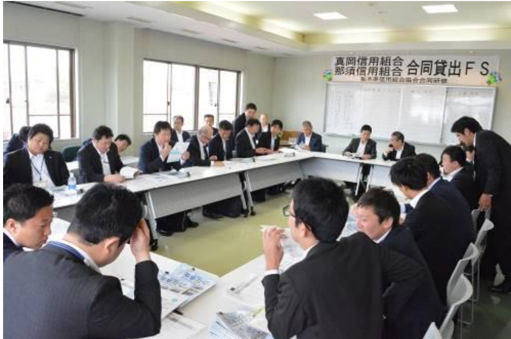
【平成 30 年 5 月 23 日 真岡信用組合と合同で実施した特別貸出 F S】