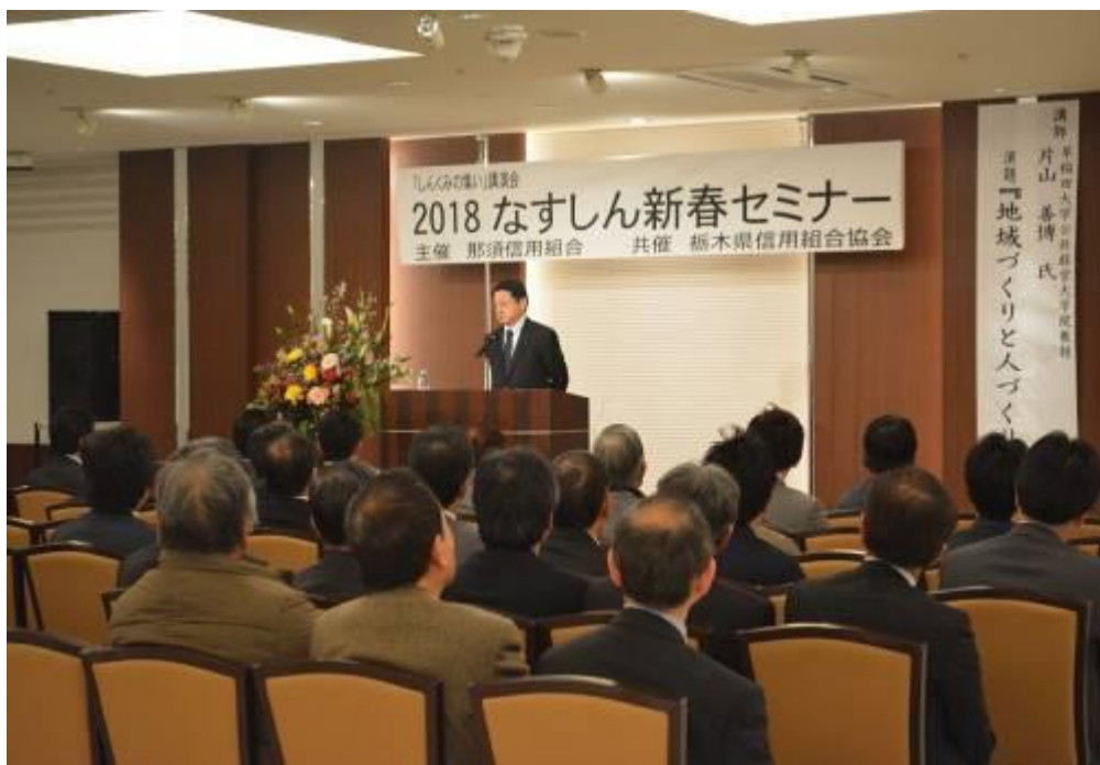
【平成30年2月7日 なすしん新春セミナー】