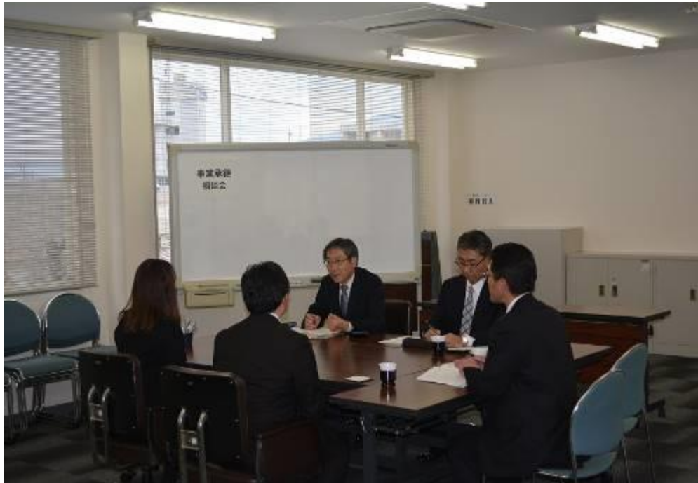
【平成 29 年 11 月 27 日 事業承継・M&A 相談会】