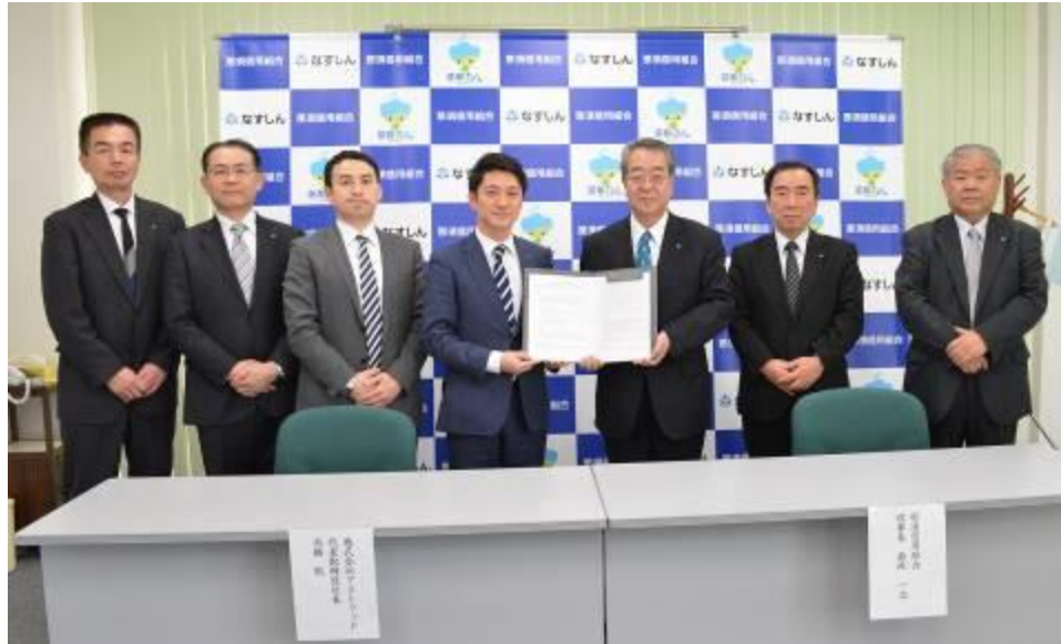
【平成 30 年 3 月 27 日 (株)アストラッドと業務提携】