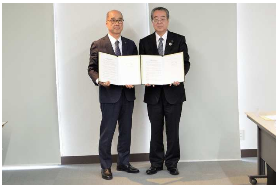
【2020年1月23日 「金融機関と認定経営革新等支援機関である 会員との連携推進制度の利用に係る覚書」締結】