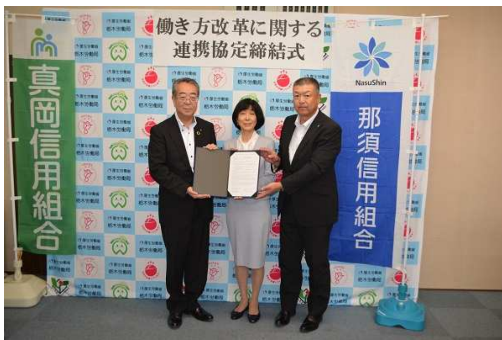
【2019年9月26日 栃木労働局との「働き方改革に関する連携協定」締結】