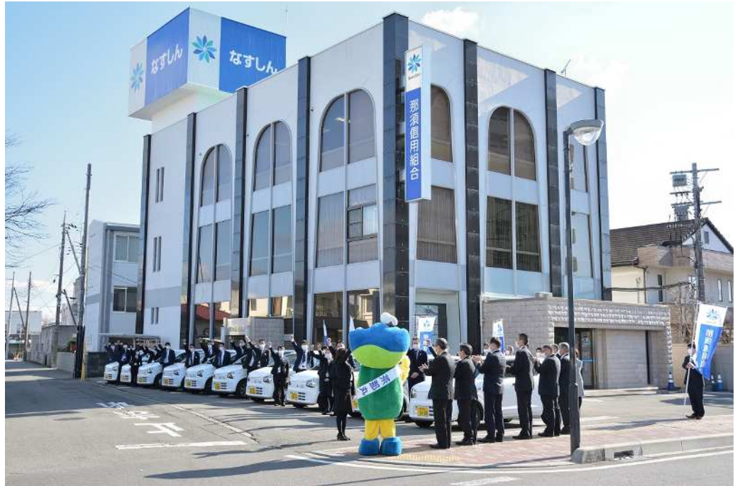
【2020年3月12日 本店営業部で実施した特別貸出FS】