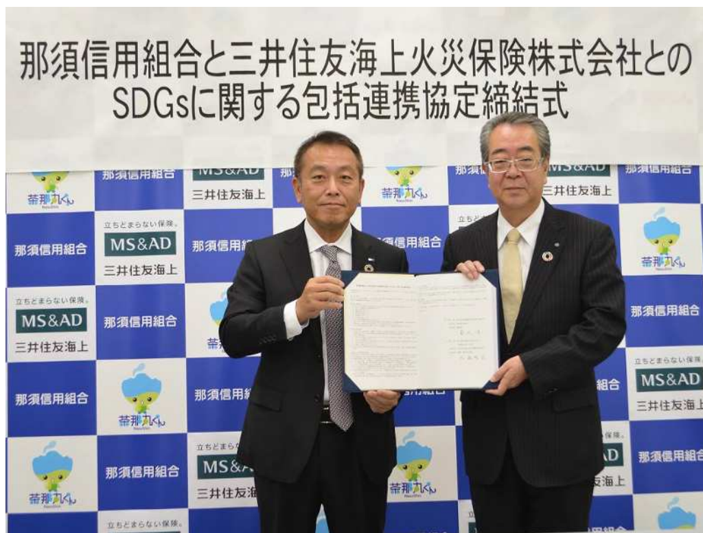
【2019年10月16日 那須信用組合と三井住友海上火災保険株式会社とのSDGsに関する包括連携協定締結式】