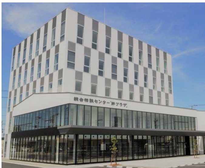
<総合相談センター「絆プラザ」>