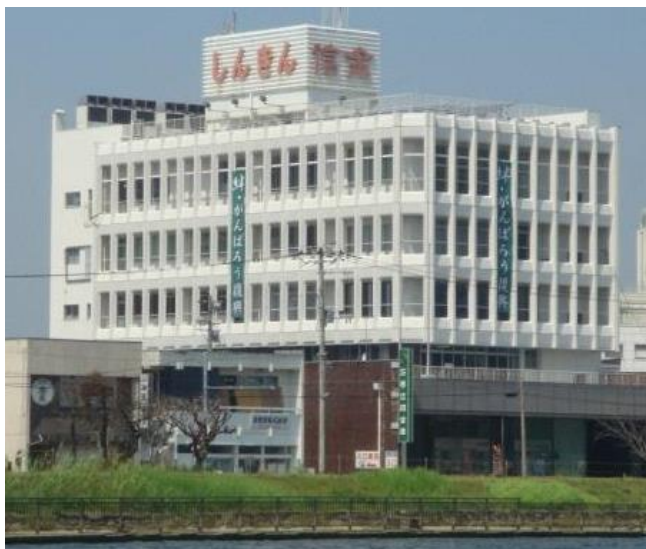
当金庫本部・本店