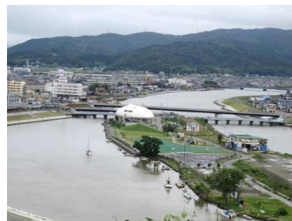
現在の石巻市の様子