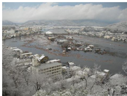
震災当日の石巻市の様子