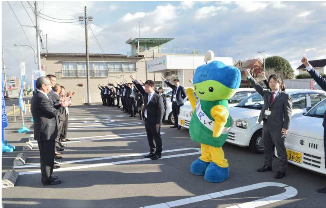
【2021年11月26日 黒磯支店で実施した特別貸出F S】