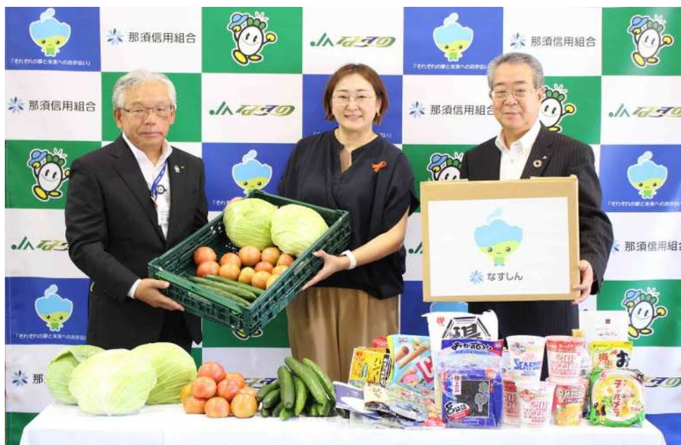
【2021年8月6日 那須信用組合と那須野農業協同組合との連携による「子供食堂応援プロジェクト」始動】

今後におきましても、当信用組合におけるSDGsの取り組みや、地域の中小規模事業者のSDGs取組支援を通して、地方創生に取り組んで参ります。