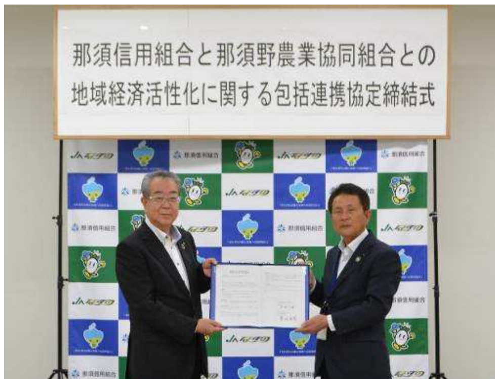
【2021年5月19日 那須信用組合と那須野農業協同組合との 地域経済活性化に関する包括連携協定締結式】

今後におきましても、地方公共団体等との連携を強化し地方創生に取り組んで参ります。