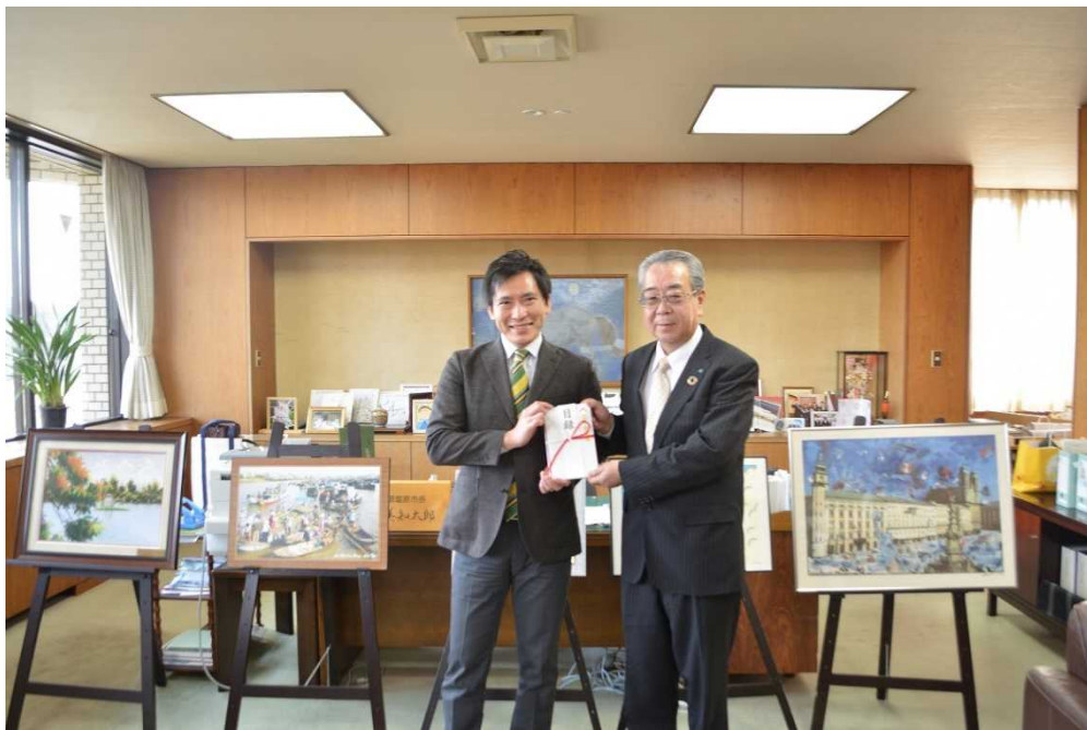
【2023年3月9日 那須塩原市へピーターパンカード寄付金贈呈】

今後におきましても、当信用組合におけるSDGsの取り組みや、地域の中小規模事業者のSDGs取組支援を通して、地方創生に取り組んで参ります。