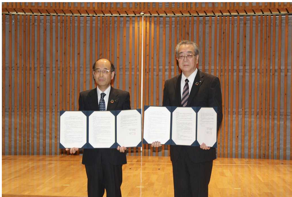
【2023年3月22日 栃木県産業振興センターと連携協定締結】

今後におきましても、地方公共団体等との連携を強化し地方創生に取り組んで参ります。