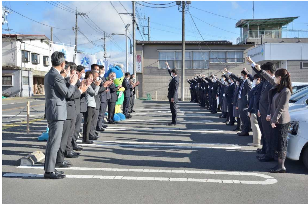
【2023年2月21日 黒磯支店で実施した特別貸出FS】