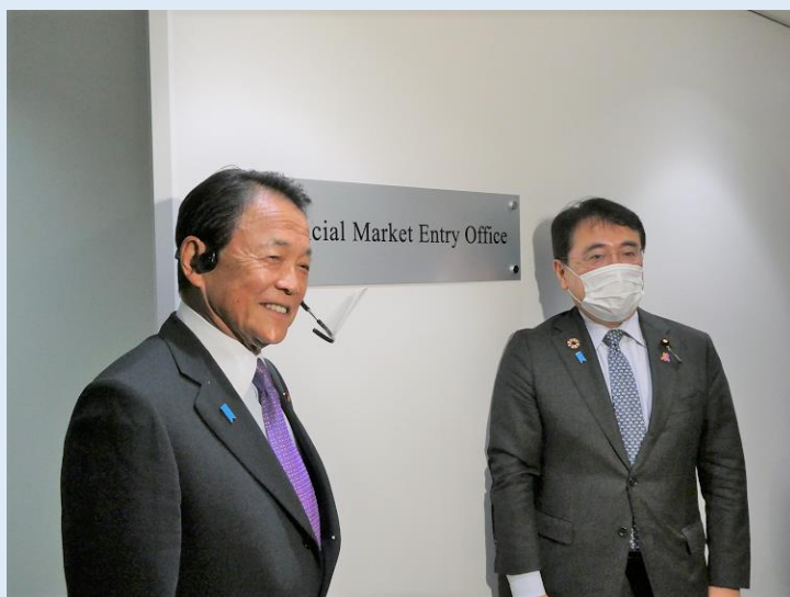
写真：設置した看板とともに報道陣の記念撮影に応じる麻生大臣(左)と赤澤副大臣(右)

海外と比肩しうる魅力ある金融資本市場への改革や、海外事業者や高度外国人材を呼び込む環境構築など、国際金融センターを実現するための諸施策に戦略的にオールジャパンで取り組んでいます。「拠点開設サポートオフィス」は、その重要な担い手の一つとして、関係者一丸となって取り組んでまいります。