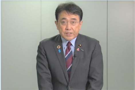
写真：ビデオメッセージによる 挨拶をする赤澤副大臣

開会挨拶の中で、赤澤副大臣は、地域金融機関が、感染拡大の影響により厳しい経営環境にある中でも見つかるビジネスチャンスを活かし、カネの仲介にとどまらず、ヒト・モノ・情報といった仲介機能を総動員して、地域の事業者を支援し産業を支えていく重要性を指摘しました。